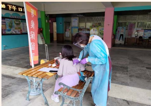
內科顏醫師戶外診療