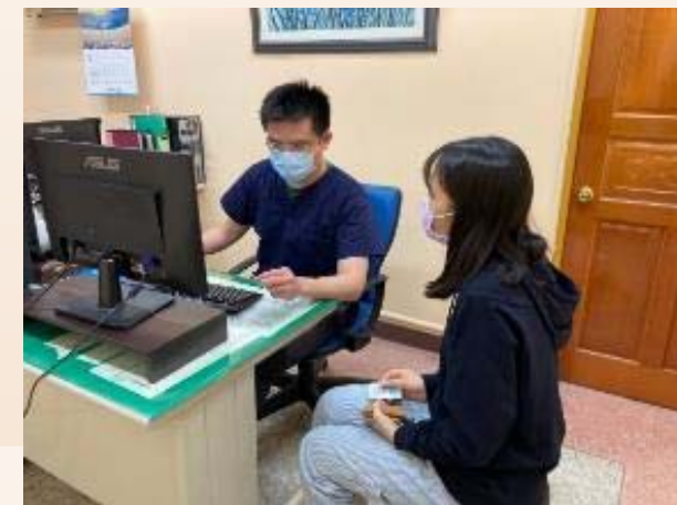
肝膽腸胃科陳醫師看診